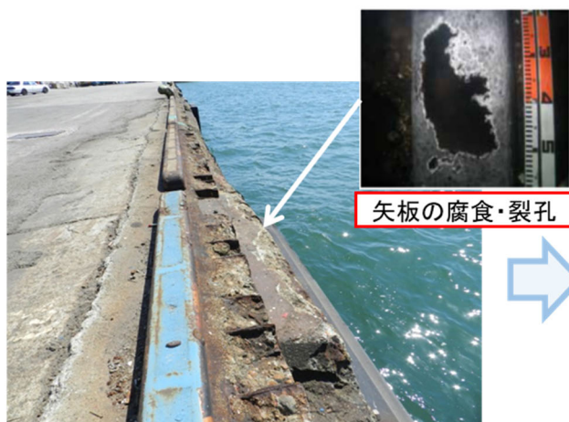
改良前の2号岸壁 （上部コンクリートの欠損、鉄筋露出）